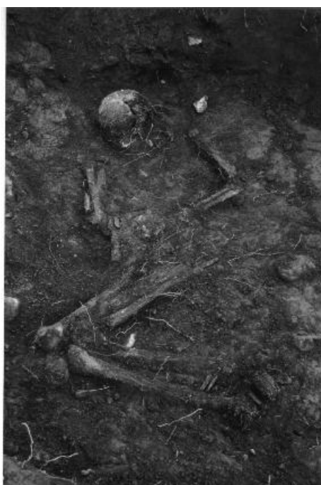
Mynd 6. Beinín sem fundust í kumlinu.

Í september stóð Minjasafn Austurlands fyrir fornleifarannsókn á kumli í landi Eyrarteigs í Skriðdalshreppi. Uppgröftur hófst þann 21. september og lauk 2. október, þó með nokkurra daga hléum. Mikið var fjallað um fundinn í fjölmiðlum og vakti rannsóknin mikla athygli bæði hér heima fyrir sem erlendis, enda reyndist kumlið vera eitt af þeim merkari, sem hingað til hafa fundist á Íslandi.