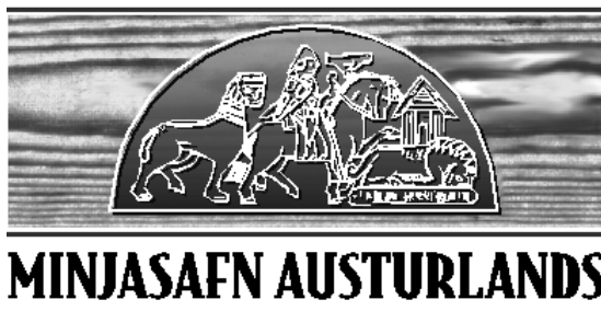
Mynd 4. Merki Minjasafns Austurlands.

Útskurður hurðarinnar myndar tvær kringlur. Í efri kringlunni er franska ævintýrið um riddarann og ljónið rakið, sem upprunið er úr riddarasögum miðalda. Sagan táknar baráttu góðs og ills, þar sem hið góða sigrar. Í neðri kringlunni má sjá sköpunarsöguna í táknrænni mynd af ornum, sem fléttast saman. Ýmsir telja að kringlurnar hafi verið þrjár talsins á hurðinni, sú þriðja neðan við hinar tvær, og að hurðin hafi verið stytt þegar ný kirkja, úr torfi og grjóti í stað timburs, var byggð á Valþjófsstað á fyrri hluta 18. aldar.