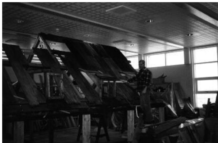
Mynd 3. Skúli Magnússon, smiður, hefur unnið að uppsetningu baðstofu frá Brekku í Hróarstungu á Minjasafni Austurlands en baðstofan á að gegna hlutverki sýningarbása í sýningarsal safnsins.

Meðal þess sem þurfti að þrifa voru baðstofuviðir frá Brekku í Hróarstungu en baðstofan á bænum var tekin niður af starfsmönnum Þjóðminjasafnsins í september árið 1969. Hún var geymd á háalofri íbúðarhússins á Skriðuklaustri. Þrifa þurfti hverja fjöl fyrir sig en húsið var tvær hæðir, með baðstofu á efri hæð. Ákveðið var að reisa einungis baðstofuna upp í sýningarsal minjasafnsins, þar sem hún á að þjóna hlutverki sýningarbása.